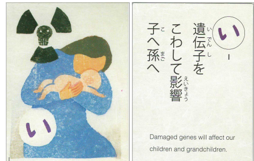
古知屋恵子「せんそうかるた」より

版画家の古知屋恵子さんが制作された「せんそうかるた」、あたたかみのある木版画と風刺の効いた言葉をじっくり味わってください。